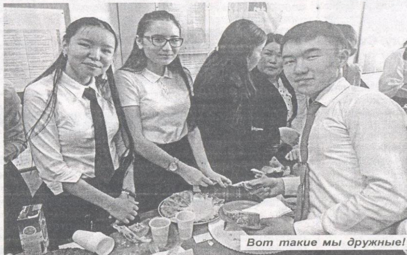
Вот такие мы дружные!

машине комитет и горячие слова. Все это продавалось быстро и на ура, так как было подготовлено по-домашнему, с душой. Простое перечисление всего, что было выставлено в эти дни на «Ярмарке», дает представление о заинтере-