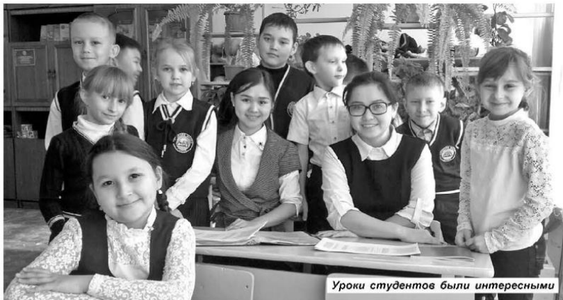
Уроки студентов были интересными

«Учитель, будь солнцем, излучающим человеческое тепло, будь почвой, богатой ферментами человеческих чувств, и сей знания не только в памяти и сознании твоих учеников, но и в их душах и сердцах...» (Ш. Амонашвили)