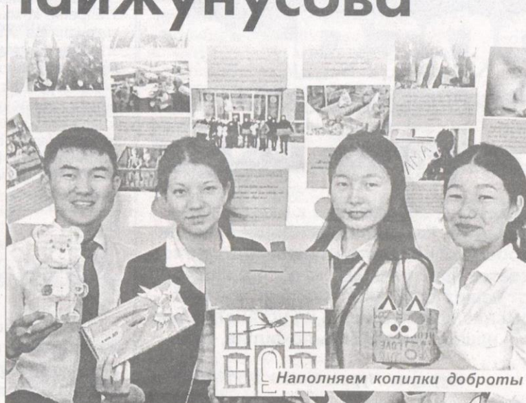
Наполняем копилку доброты