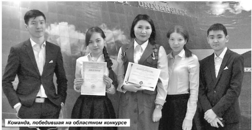
Команда, победившая на областном конкурсе

Поиски останков Кенесары хана будут продолжены