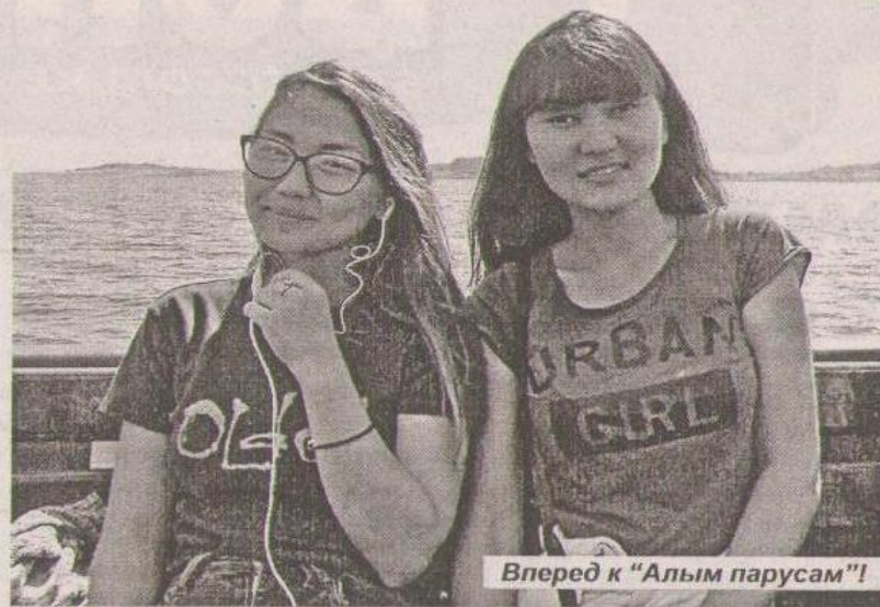
Вперед к «Алым парусам»!